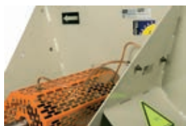
Внешние отверстия для смазки для удобства обслуживания